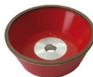
Mola diamantata: Diamond grinding wheel: Алмазный шлифкруг: D107 D46 D15