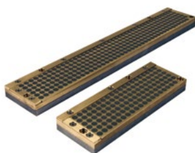
Piano magnetico a campo aperto per metallo duro: Open field high power magnetic chuck for carbide inserts:

Магнитная плита для твёрдых сплавов: 400x70x20 200x70x20